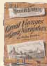
「Great Voyages and Great Navigators, second half 1886 (明治19) New York