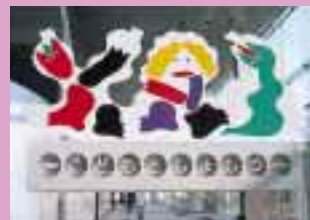
館内・館外サイン