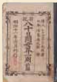
「新説八十日間世界一周」前編 明治11年6月刊 川島忠之助翻訳出版