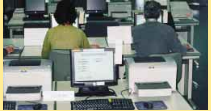
お調べものには、雑誌記事索引などのCD-ROMやインターネットもご利用いただけます。 (宮城県図書館内)

皆さん、普段利用している図書館に自分の求めている資料がなかったときや調べていることがその図書館で解決できなかったとき、どうしていましたか？そのままあきらめていましたか？でもちょっと待って！図書館は他の図書館と協力することにより、自館で足りない部分を補い合っています。今回の特集は、図書館相互のつながり、「図書館ネットワーク」について取り上げます。