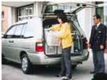
協力車で本を運びます。